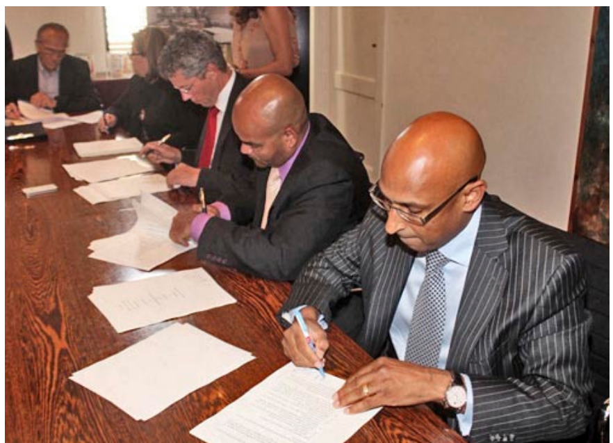
E momento di firmamento na oficina di AIB pa financiamiento di e proyecto di ampliacion y renobacion di dr. Horacio Oduber Hospital.